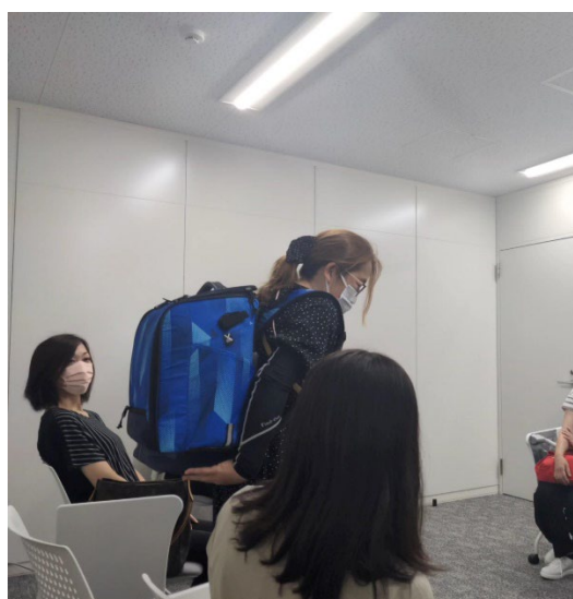
エスエスケイから説明を受け、意見交換を行う参加者の皆様

今後の展望として、フィードバック座談会で出た意見を参考にして引き続き本プロジェクトを進めてまいります。オリジナルバッグの完成は8月下旬頃を予定しており、商品のお披露目会も予定されています。お披露目会にはご家族を招待し、完成したオリジナルバッグをお子様にごプレゼントいたします。